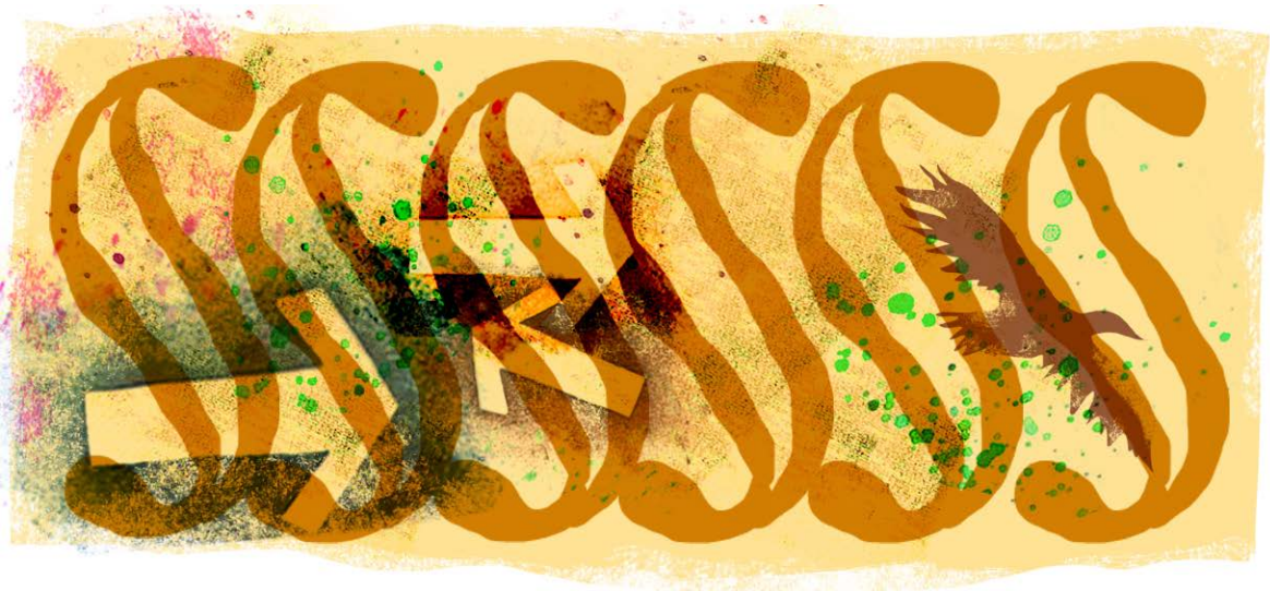
Illustration: Katrine Clante.

Det ville have været mere lig den svenske voldtægtsbestemmelse, som allerede i 2018 blev ændret, og hvis indledning nu lyder: