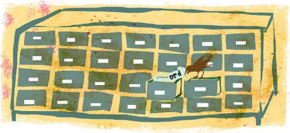
Illustration: Katrine Clante.

af ordet samtykke i straffelovens § 216 understreger at gensidighed eller enighed må være fundamentet for sex – eller for at bruge de to ord der indgår i samtykke – at begge parter sammen må tykkes at sex er en god idé. Omvendt kan det ikke afvises at samtykke i kraft af førsteleddet sam- i højere grad end frivillighed kan give associationer til noget der sker i fællesskab, i overensstemmelse, som et samarbejde, som noget der kræver en indbyrdes forbindelse e.l.